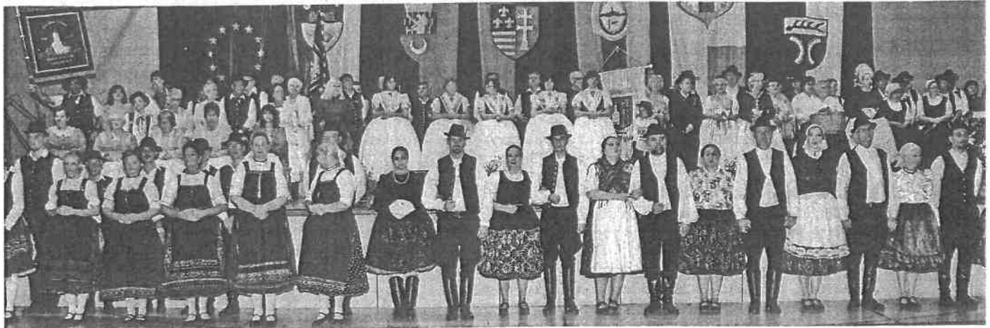
Bundesschwabenball 2017

Nachdem der Bundesschwabenball bereits im letzten Jahr der Corona-Pandemie zum Opfer gefallen war, wurde die größte Veranstaltung im Jahreskalender der Landsmannschaft der Deutschen aus Ungarn (LDU) jetzt erstmals digital ausgerichtet.